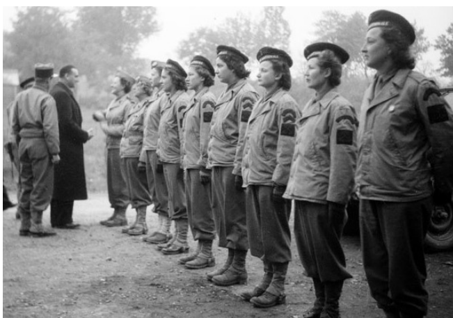
Sections Féminines de la Flotte du RBFM de la 2e DB, septembre 1944

Dès 1940, plusieurs centaines de femmes rejoignent les rangs des FFL à Londres, mais aussi en Afrique du Nord (Algérie, Maroc, Tunisie). Elles s'engagent dans les trois corps d'Armée et sont présentes dans la plupart des services. Souvent dénigrées par les hommes, sous-estimées aussi, ces femmes accomplissent pourtant des tâches essentielles entre 1940 et 1945.